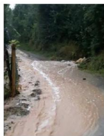
LSI - La Glèbe